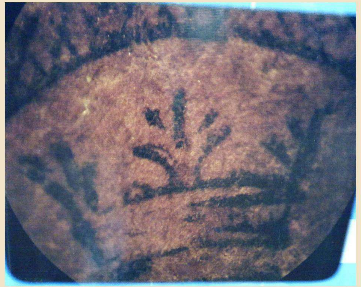
La Corona de la Santísima Virgen y del Niño son típicamente indígenas.

Demos gracias a Dios y a la Santísima Virgen María por este gran prodigio y oremos todos: "Nuestra Señora de Coromoto Patrona de Venezuela, renovad la Fe, en toda la extensión de nuestra patria. Amén"